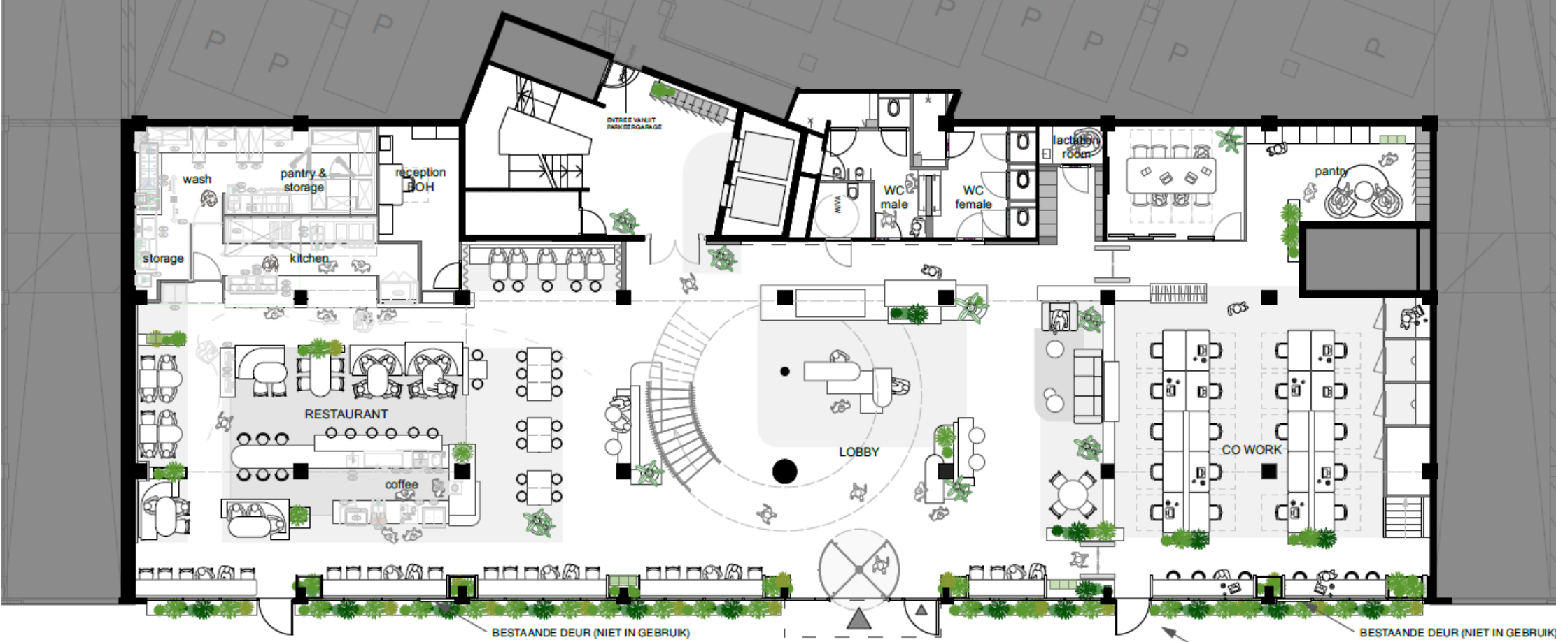
1 BEGANE GROND_GEBOUW B_LAYOUT